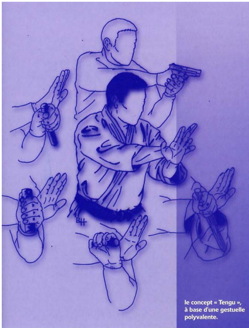
le concept « Tengu », à base d'une gestuelle polyvalente.