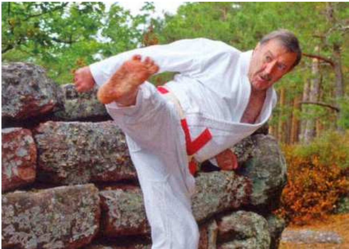
Van Samoerai tot Tengu 4