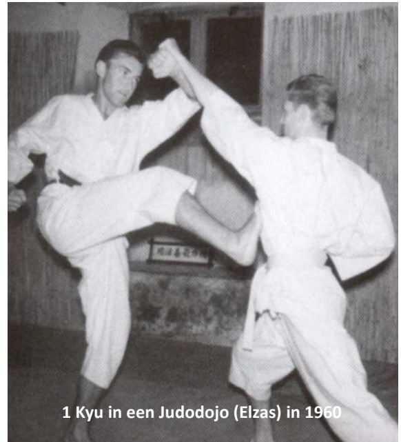
1 Kyu in een Judodojo (Elzas) in 1960

"Er was aan het einde van de jaren 60 die bewuste "Beker van Frankrijk" te Parijs. Eén van mijn leerlingen werd er ernstig gekwetst. Na afloop van het gevecht was hij letterlijk op de grond in elkaar geslagen en moest hij worden afgevoerd met de ziekenwagen. De dader was een geëxciteerde jongeman - een 1ste kyu waarvan ik de naam niet zal vermelden - die mij voor de ogen van een duizendtal getuigen in Coubertin, in het gezicht spuwde toen ik trachtte tussenbeide te komen. Als centrale scheidsrechter diskwalificeerde ik hem onmiddellijk. Maar het ergste van heel deze historie was dat deze jonge dwaas, diezelfde avond nog een nieuwe kans kreeg om toch te kunnen deelnemen aan de finales. Ondertussen lag mijn leerling gewond in het ziekenhuis.