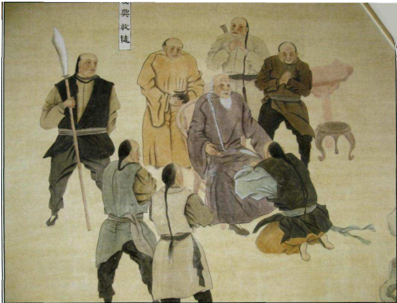
Fresque à Chenjiagou.